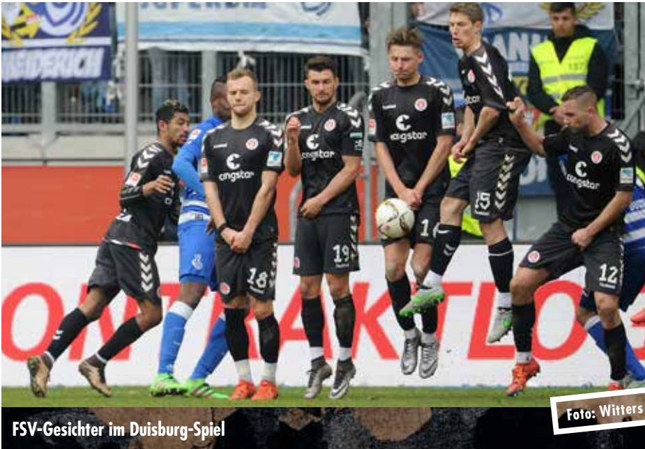
FSV-Gesichter im Duisburg-Spiel