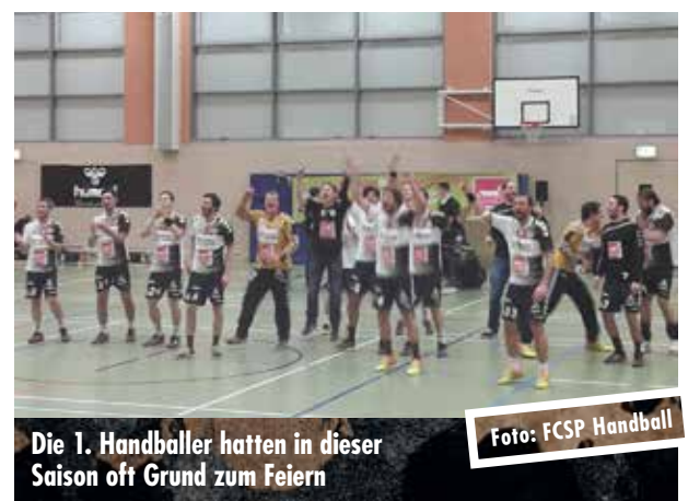
Die 1. Handballer hatten in dieser Saison oft Grund zum Feiern

Da es aber nicht nur in der Ausweichhalle in der Thedestraße sondern auch auswärts sehr gut lief, können die Handballer inzwischen entspannt vom vierten Platz aus ins Saisonfinale starten. Am vergangenen Sonntag siegte das Team souverän mit 28 zu 22 gegen den TuS Lübeck und baute das Polster zu Platz fünf auf sechs Zähler aus. Entsprechend hat sich vor den Duellen mit den Spitzenteams der SG Wiffl Neumünster und dem HSV II auch der Anspruch verschoben: „Jetzt ist es unser Ziel, unter den ersten vier zu bleiben. Damit hätten wir unsere beste Platzierung in der Oberliga erreicht und wären absolut zufrieden.“